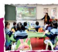
AC SMART CLASSROOMS