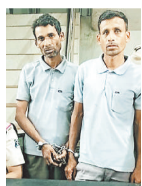
पुलिस गिरफ्त में आरोपी।

शराब पीने के बाद विवाद करने पर युवक की दो भाइयों ने मारपीट कर पेड़ की जड़ से हमला कर हत्या कर दी थी। तीन दिन बाद पुलिस ने फरार दोनों भाइयों को गिरफ्तार कर लिया है।