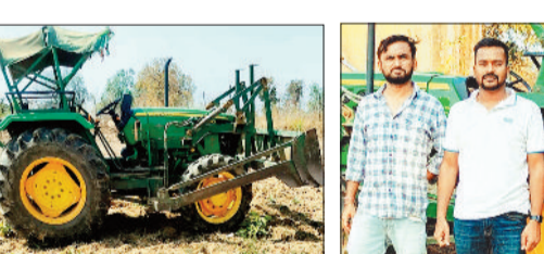
जब्त ट्रैक्टर व गिरफ्तार आरोपी।

जंगल की भूमि में अवैध रूप से ट्रैक्टर चलाकर जोताई करने वाले आरोपी को पकड़कर वन विकास निगम की टीम ने वन अधिनियम के तहत कार्रवाई की है। इस कार्रवाई में ट्रैक्टर जब्त करने के साथ आरोपी को भी गिरफ्तार कर लिया गया है। छत्तीसगढ़ राज्य वन विकास निगम के प्रबंध संचालक ने अवैध कटिंग, अतिक्रमण और उत्खनन पर नियंत्रण करने प्रत्येक परियोजना मंडल में नियमित भ्रमण कर आवश्यक कार्रवाई करने निर्देश दिया है। प्रबंध संचालक के निर्देश पर परियोजना मंडल में सुबह और दोपहर के साथ रात में भी गश्त की जा रही है। इसके तहत वन विकास निगम के कोटा परियोजना मंडल में