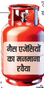
गैस एजेंसियों को गनगाना रवेया

उपभोक्ताओं को गैस की डिलीवरी देने से मना करने के मामले सामने आ रहे हैं। इसके पीछे गैस एजेंसियों के द्वारा संबंधित उपभोक्ता के द्वारा ई-केवायसी नहीं कराया जाना बताया जा रहा है। अब सवाल यह है कि जिन उपभोक्ताओं को आज ई-केवायसी नहीं होने के कारण सिलेंडर की डिलीवरी देने से मना किया जा रहा है, उन्हीं उपभोक्ताओं को गैस एजेंसियों ई-केवायसी नहीं होने के बाद भी बीते कई सालों से सिलेंडर की डिलीवरी करती आ रही हैं। आज जब पूरे देश में गैस सिलेंडर के लिए मारामारी मची हुई है, तब गैस एजेंसियों को ई-केवायसी के बगैर सिलेंडर दे ही नहीं पाने की बात याद आ रही है।